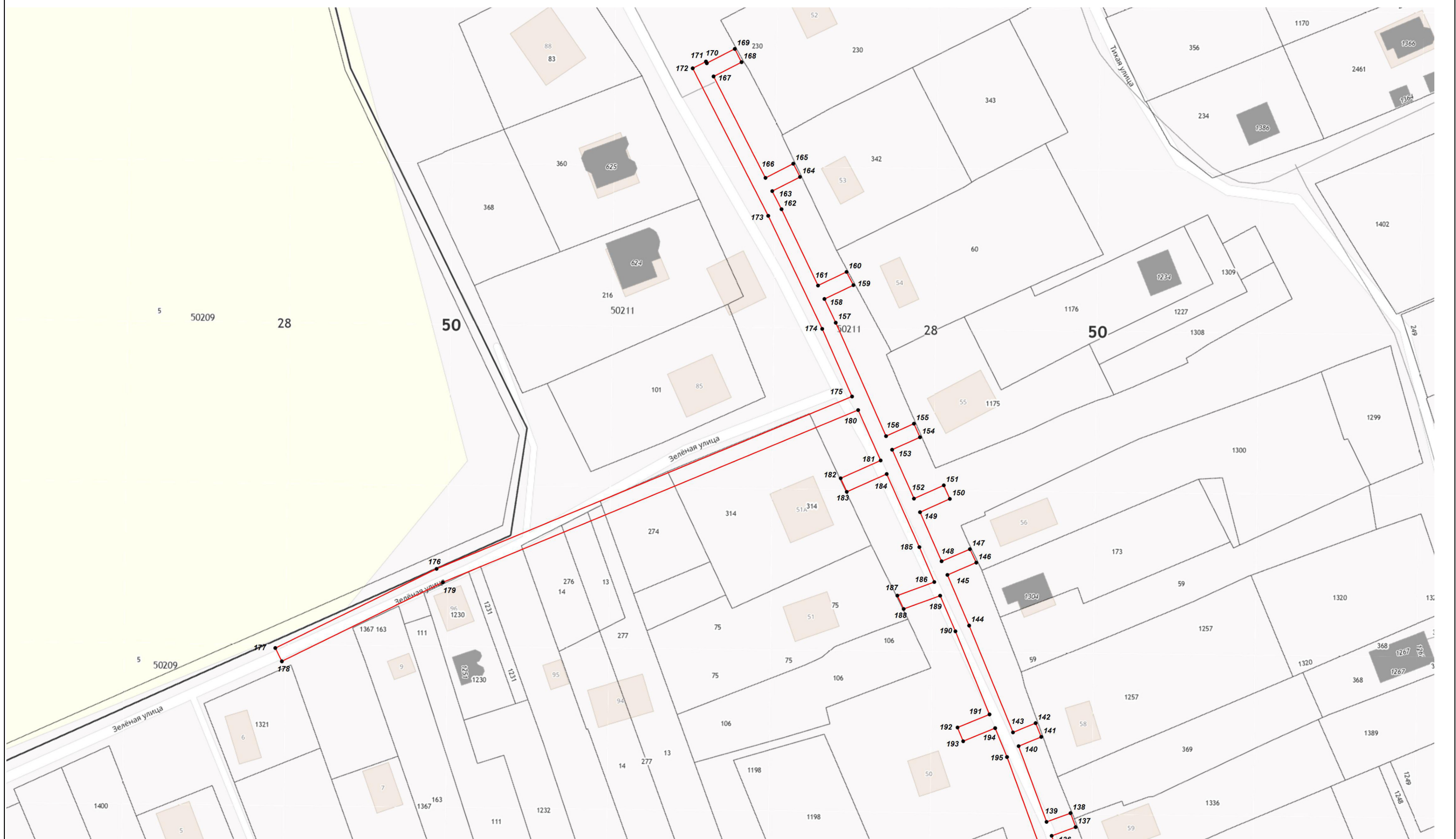
Масштаб 1:1 000